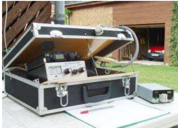
Die Gartenfunksaison hat begonnen